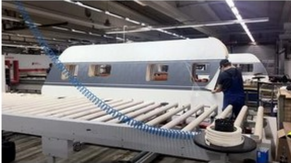
Seitenwände und Fußböden werden im Werk gefertigt.

Das Hobby-Wohnwagenwerk in Fockbek bei Rendsburg gilt als Marktführer in der Wohnwagen- und Caravan-Branche in ganz Europa. 12.000 bis 20.000 Wohnwagen und ca. 2.000 Wohnmobile verlassen jährlich nach ihrer Fertigung die Hallen.