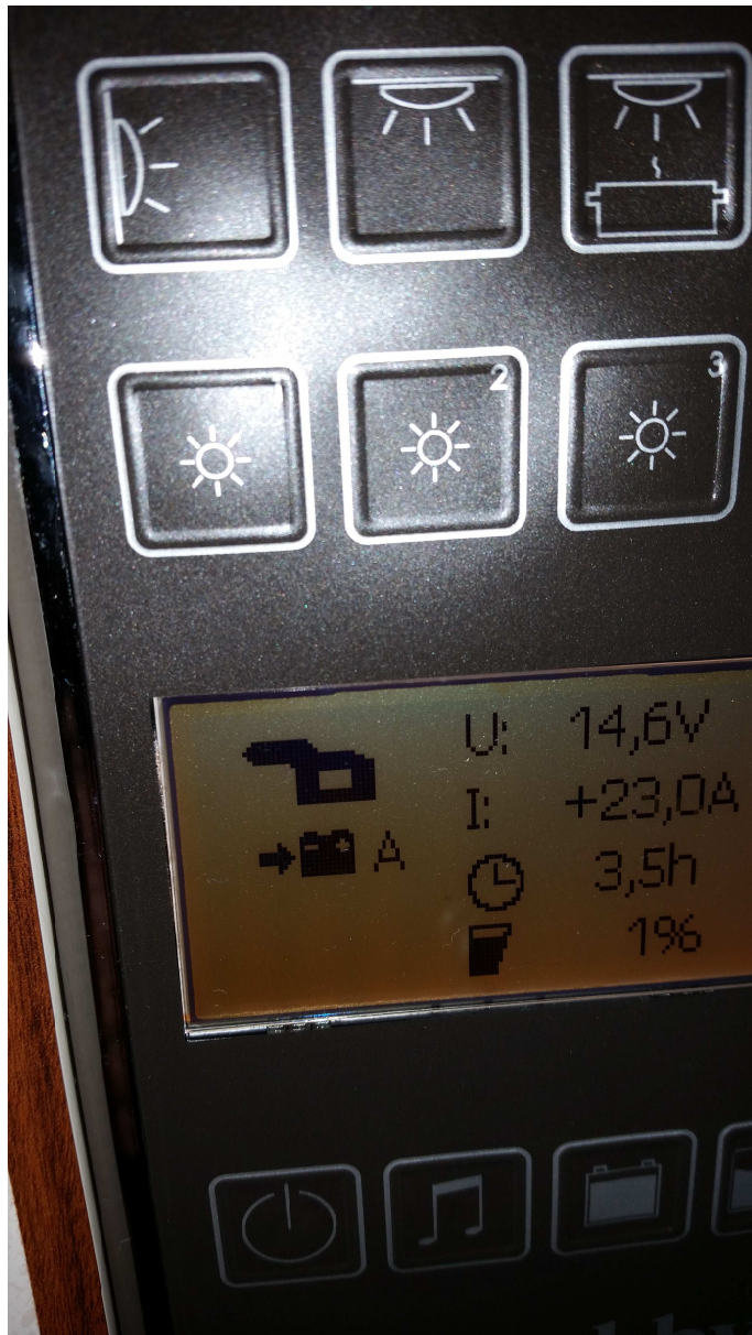
Ladespannung und Ladestrom.