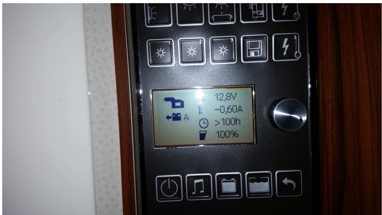
Ladezustand nach ca. 30std. laden.